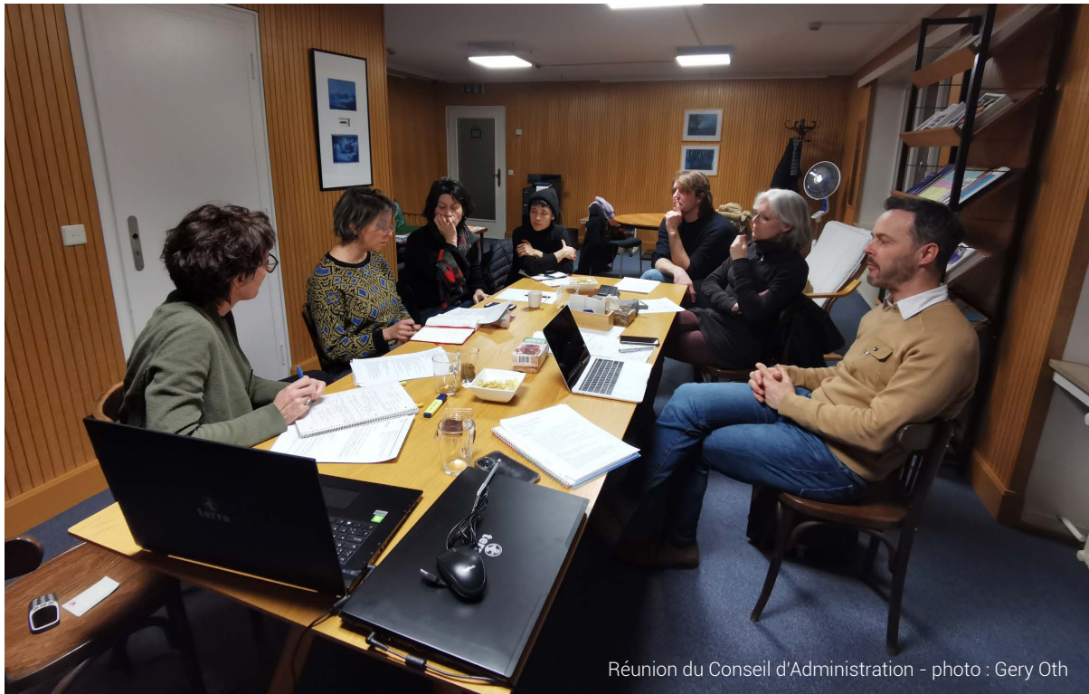
Réunion du Conseil d'Administration