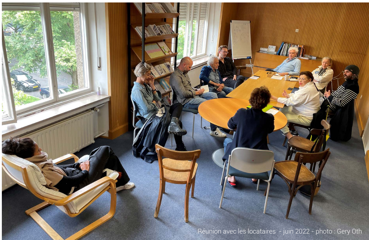
Réunion avec les locataires - juin 2022 - photo : Gery Oth