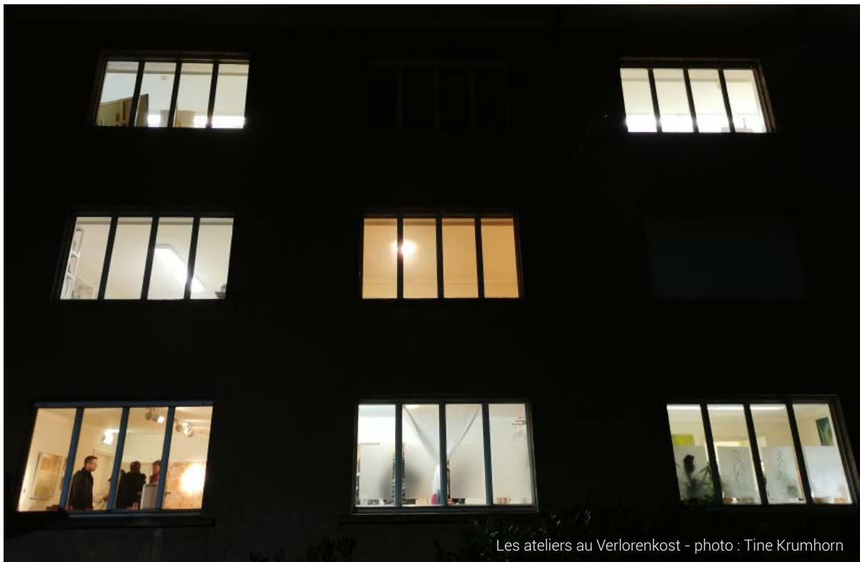
Les ateliers au Verlorenkost