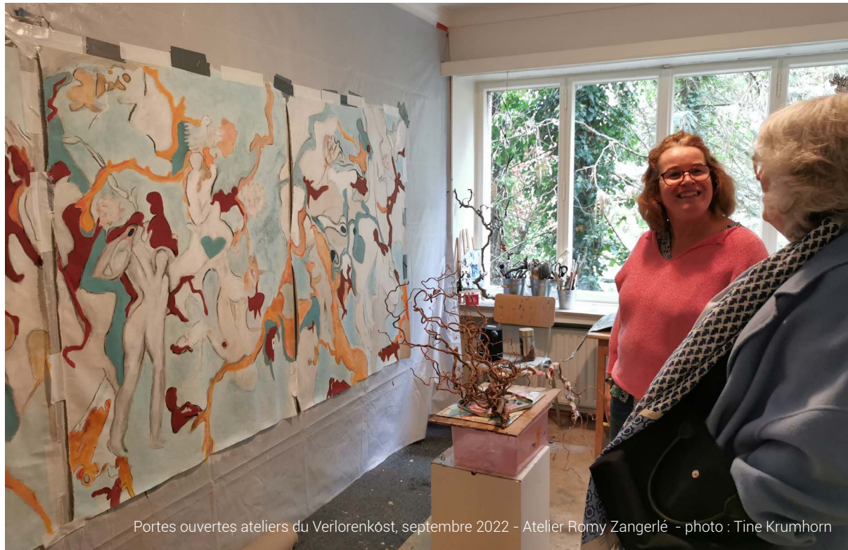
Portes ouvertes ateliers du Verlorenkôst, septembre 2022 - Atelier Romy Zangerlé